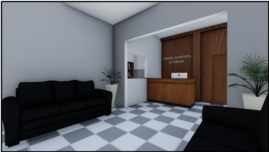
PERSPECTIVA 02 SEM ESCALA