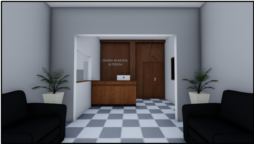
PERSPECTIVA 01 SEM ESCALA